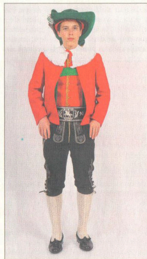
L prim dunsel.