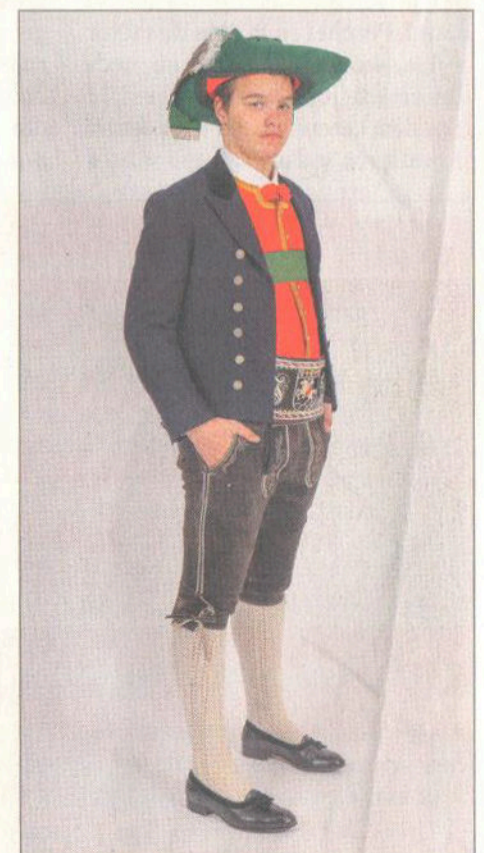
L jëunn dal ciapel vërt.