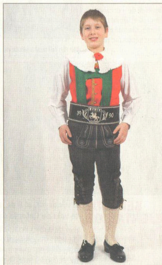
L pitl mut.